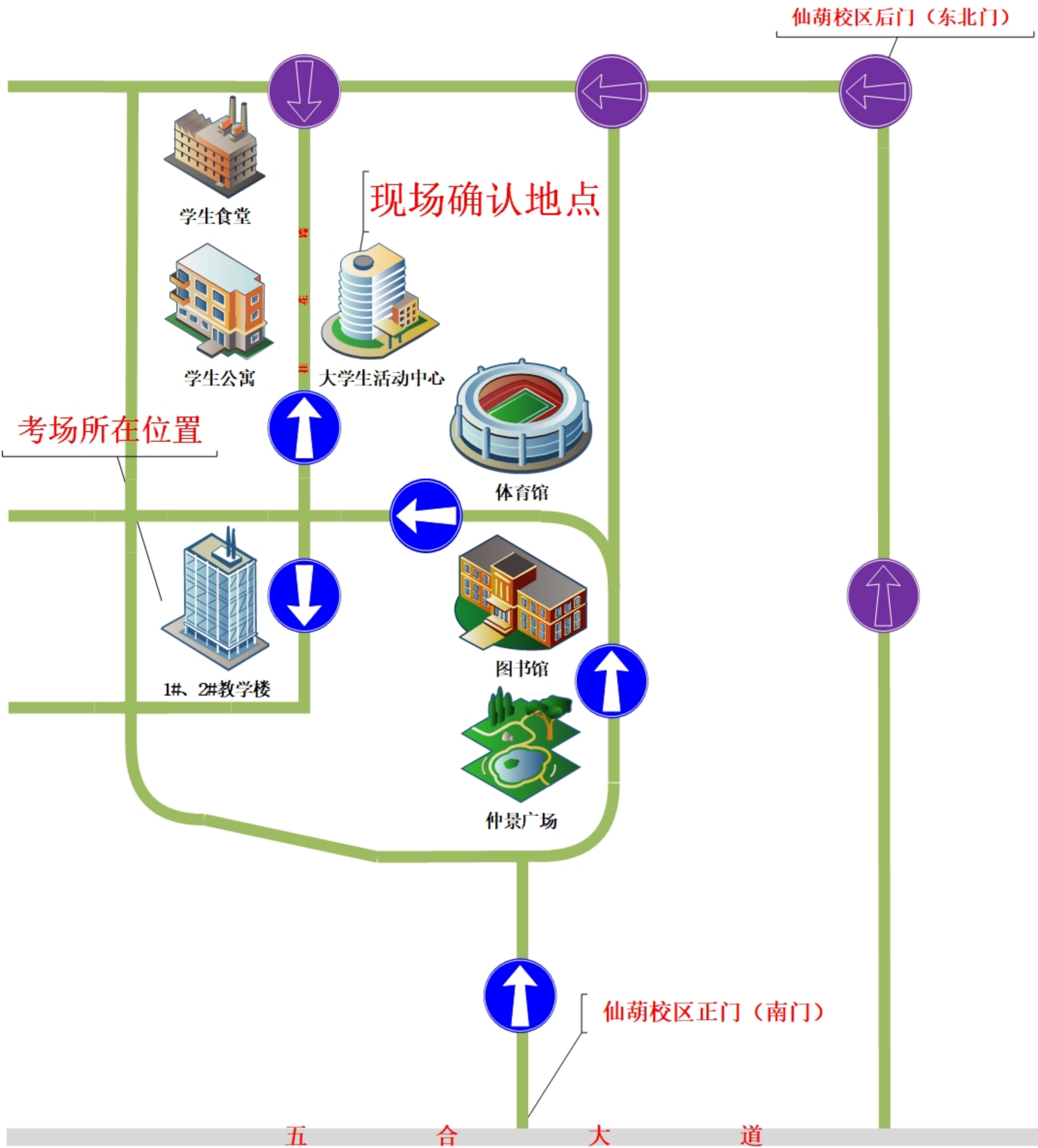
广西中医药大学仙葫校区平面示意图